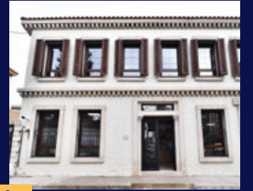
100. Yıl Kitap Kafe