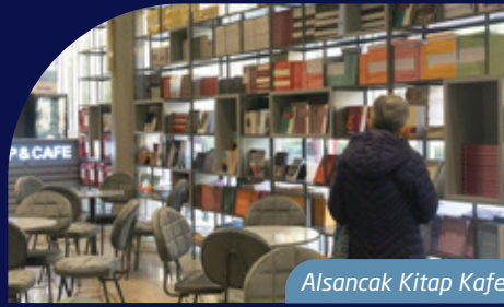
Alsancak Kitap Kafe